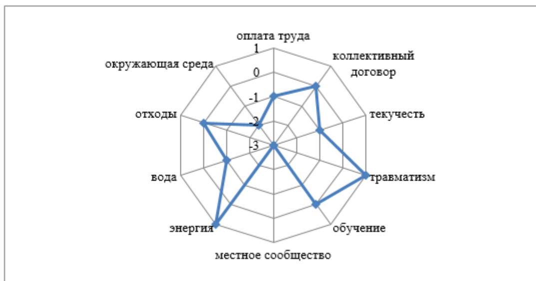
Рис. 2. Динамика показателей экспресс-оценки КСО Сбербанка за 2017–2018 гг.

Очевиден тот факт, что наибольшее внимание уделяется развитию ресурсосбережения, а именно энергопотреблению, а также развитию системы защиты персонала от травматизма на рабочем месте. В частности, это объясняется инцидентом, произошедшим в 2017 г., из-за которого 4 инкассатора погибли. В 2018 г. произошло выделение денежных средств на улучшение условий труда и снижение травматизма.